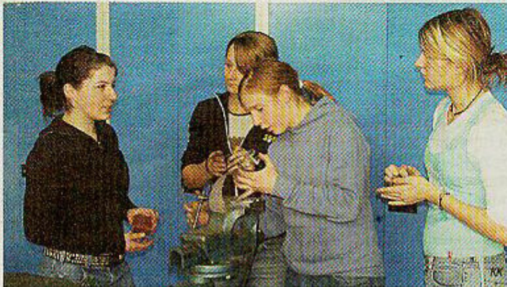
Einige Mädchen der PTS Gleisdorf haben sich gleich zu Schnuppertagen angemeldet.

ZAK – Zeitung der Kammer für Arbeiter und Angestellte für Steiermark, Nr. 4/Februar 2006, S. 17