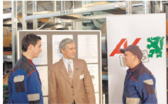
Die AK gab beim Lehrlingsprojekt Tipps zum Umgang mit Geld.